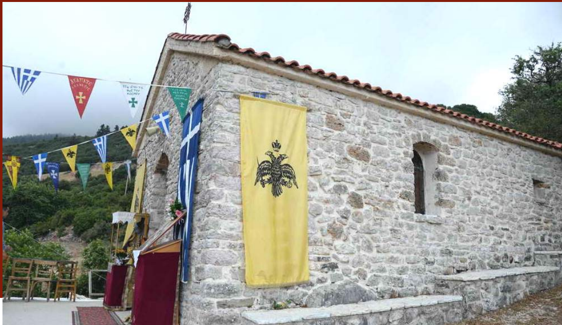
ΕΚΚΛΗΣΙΑΚΑ ΠΑΝΑΓΙΑ ΖΟΥΜΠΑΤΑ

Ζουμπατιώτες (Ιστορικά πρόσωπα και γεγονότα) ήταν και οι οπλαρχηγοί Θεόδωρος Τζούνης, Θεόδωρος Χαρμπίλας, Σπανοκυριάκος, Δημήτριος Νενέκος και Αθανάσιος Σαγιάς . Οι δύο τελευταίοι ήταν και πρώτα ξαδέφφια. Ο Νενέκος διακρινόταν για την παλληκαριά και τα ηγετικά προσόντα. Ο Παλαιών Πατρών Γερμανός αναφέρει πως πήρε μέρος σε όλες τις μάχες της περιοχής. Στη μάχη του Γηροκομείου, του Πουρναροκάστρου, του Σαραβαλίου καθώς και της Γαστούνης στην οποία είχε πολεμήσει τους Λαλαίους Τούρκους. Επίσης, πήρε μέρος στην πολιορκία της Πάτρας το Μάρτη του 1821, μαζί με τους συγχωριανούς του οπλαρχηγούς, καθώς και στην πρώτη πολιορκία του Μεσολογγίου στο πλευρό του Κανέλλου Δεληγιάννη.