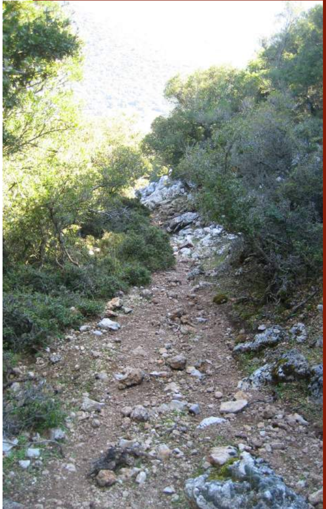
ΤΟ ΜΟΝΟΠΑΤΙ ΤΟΥ Π. ΠΑΤΡΩΝ ΓΕΡΜΑΝΟΥ ΚΟΝΤΑ ΣΤΑ ΛΑΤΣΕΪΚΑ