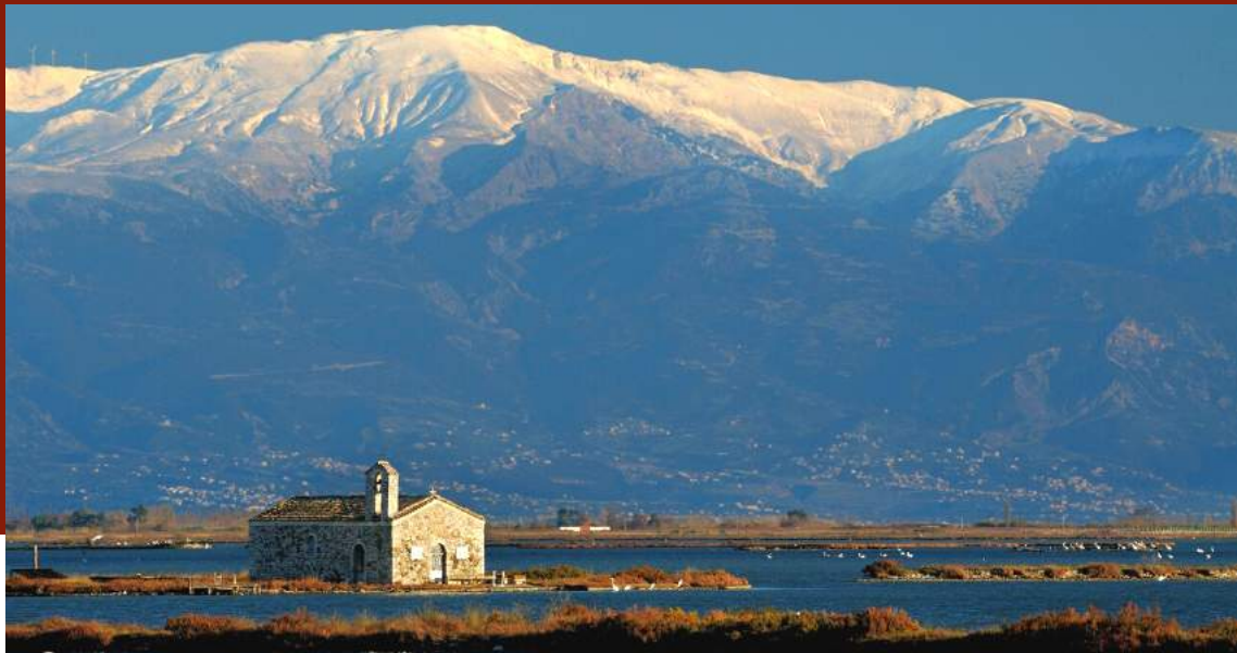
ΤΟ ΠΑΝΑΧΑΪΚΟ ΑΠΟ ΤΗ ΚΛΕΙΣΟΒΑ ΛΙΜΝΟΘΑΛΑΣΣΑ ΜΕΣΣΟΛΟΓΓΙΟΥ