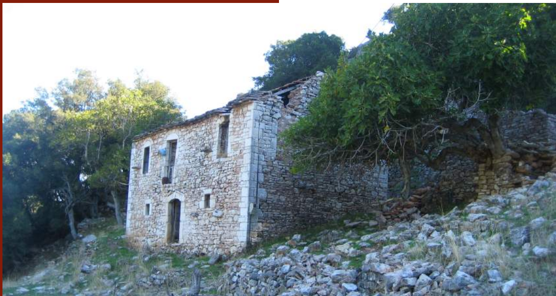
ΧΑΝΙ ΒΑΛΑΤΟΥΝΑΣ - ΠΕΤΡΩΤΟ