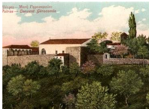
ΙΕΡΑ ΜΟΝΗ ΓΗΡΟΚΟΜΕΙΟΥ

Στον εκεί πύργο (δεν σώζεται πλέον) οχυρώθηκαν Καλαβρυτινοί και Κυπαρίσσιοι αγωνιστές καθώς και Αχαιοί υπό τον Ευάγγελο Κουμανιώτη. Οι Τούρκοι απέτυχαν να εκπορθήσουν τον Παλαιόπυργο και από εκεί άρχισε η ελληνική αντεπίθεση, η οποία είχε τη σφραγίδα του μεγάλου Θ. Κολοκοτρώνη. Στη μάχη του Γηροκομείου διακρίθηκαν επίσης οι : Δημήτριος Νενέκος, Ζουμπατιώτης οπλαρχηγός και ο Νικόλαος Πετμεζάς, γόνος της γνωστής οικογένειας από τα Σουδενά Καλαβρύτων.