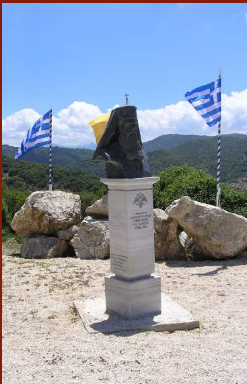
ΤΟ ΜΝΗΜΕΙΟ ΤΟΥ ΓΡΗΓΟΡΙΟΥ ΔΕΡΚΩΝ ΣΤΗΝ ΖΟΥΜΠΑΤΑ

Κορυφαίος Ζουμπατιώτης αναδείχθηκε ο μητροπολίτης Δέρκων Γρηγόριος (Ιστορικό πρόσωπο) , ο οποίος γεννήθηκε περί το 1750 στη Ζουμπάτα. Οι Τούρκοι θαυμάζοντας τόσο τις μεγάλες ικανότητες όσο και την εξυπνάδα του, τον αποκαλούσαν Μόραλι - Σεϊτάν : Πελοποννήσιος Σατανάς. Έζησε ως μοναχός στη μονή Αγίου Αθανασίου (βρίσκεται στο Φίλια Καλαβρύτων) και στη μονή Ταξιαρχών στο Αίγιο .