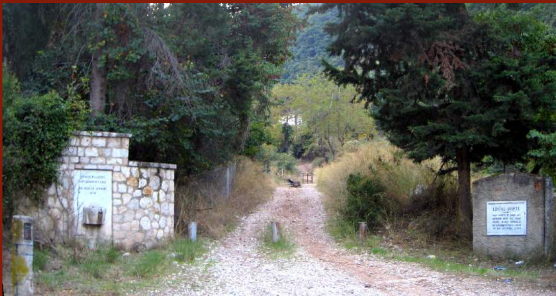
ΑΡΧΗ ΜΟΝΟΠΑΤΙΟΥ_ΑΧΑΪΑ ΚΛΑΟΥΣ