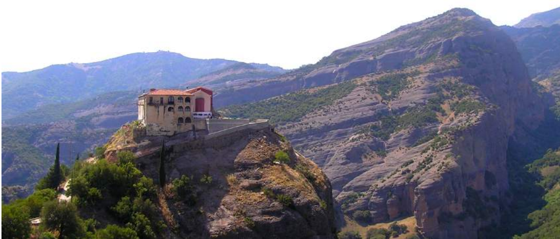
ΙΕΡΑ ΜΟΝΗ ΜΑΚΕΛΛΑΡΙΑΣ