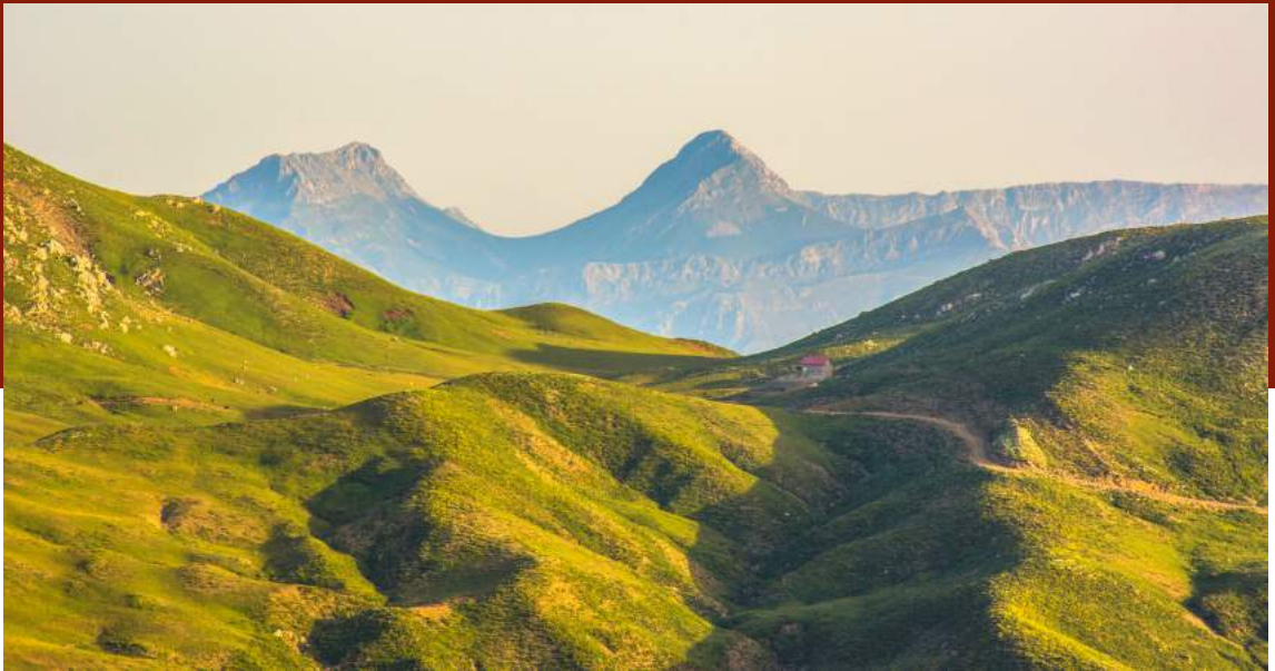
ΠΑΝΑΧΑΪΚΟ, ΟΡΟΠΕΔΙΟ ΠΡΑΣΟΥΔΙ - ΚΟΡΥΦΕΣ ΕΡΥΜΑΘΟΥ

Η υποβαθμισμένη βλάστηση, συνοδευόμενη από γυμνό έδαφος προσφέρει καταφύγιο σε μεγάλο ποσοστό της ενδημικής χλωρίδας του όρους και κατά συνέπεια είναι, από χλωριδική άποψη, η πιο σημαντική περιοχή του όρους. Από χλωριδική άποψη η μεγάλη σημασία του Παναχαϊκού έγκειται στην παρουσία πολλών ενδημικών φυτών. Πολλά από αυτά είναι Πελοποννησιακά ενδημικά. Η πανίδα των σπονδυλωτών που έχει καταγραφεί στην περιοχή παρουσιάζει μεγάλη ποικιλότητα. Αξιοσημείωτο ενδιαφέρον παρουσιάζουν οι υδάτινοι σχηματισμοί του Παναχαϊκού όρους (Λεκάνες Γλαύκου, Χάραδρου, Σέλεμνου, Σαλμενίτικου ή Φοίνικα και Λουμπιστιάνικου) στις οποίες ρέουν τα πλούσια σε όγκο επιφανειακά νερά του βουνού δημιουργώντας χαρακτηριστικά παραποτάμια δάση και βλάστηση.